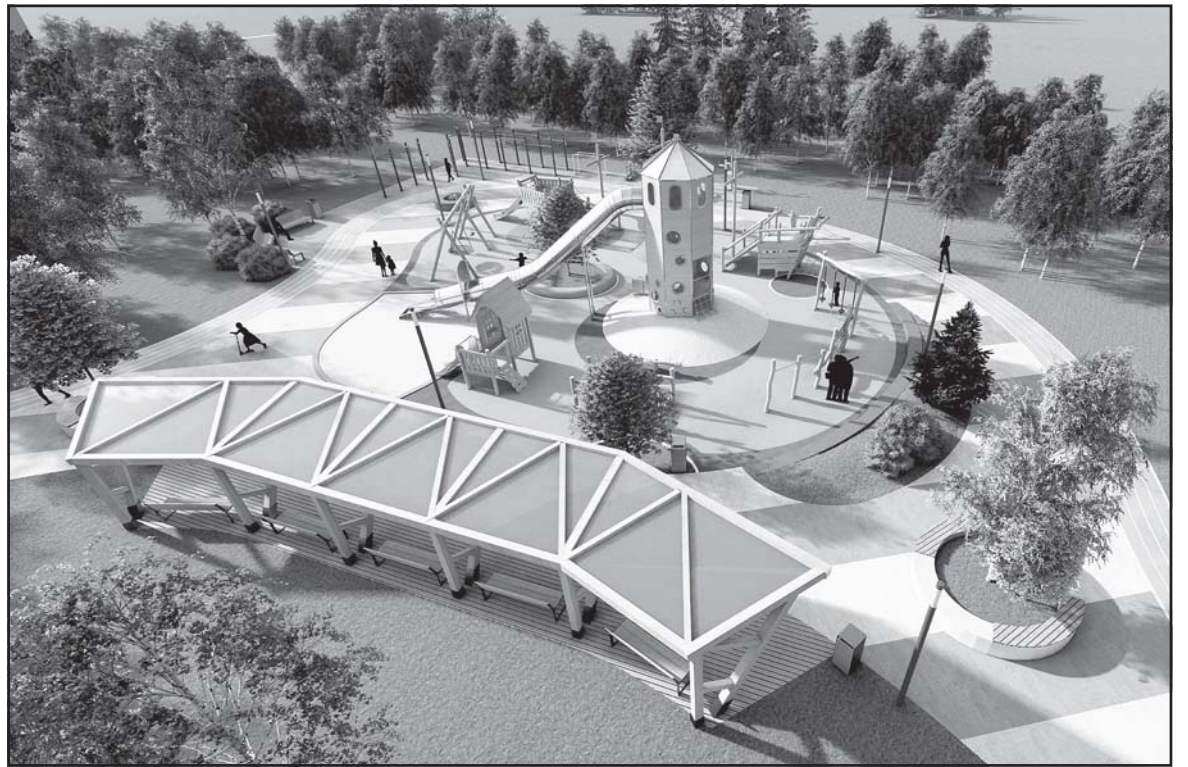
Дизайн-проект «Сквер «Маяк» с детской игровой спортивной площадкой по ул. Гоголя»