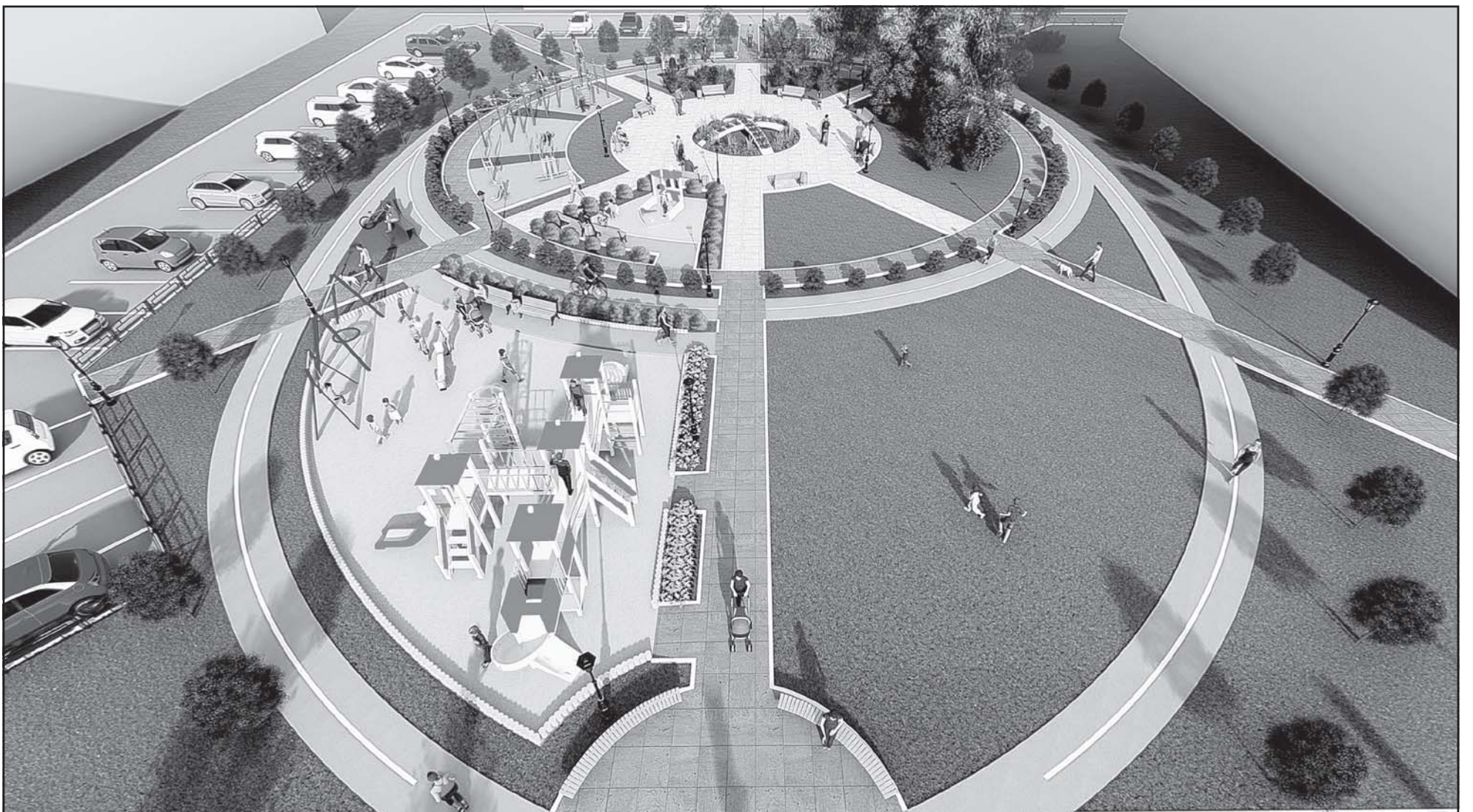
Дизайн-проект «Благоустройство территории по адресу: микрорайон Геолог, 8, 9, 10»