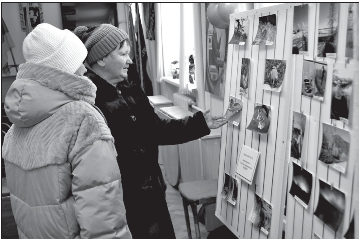
Посетители фотовыставки обсуждают работы ветеранов-педагогов