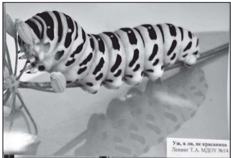
Уж, и ли, не красавица Ленинг Т.А. МДОУ №14