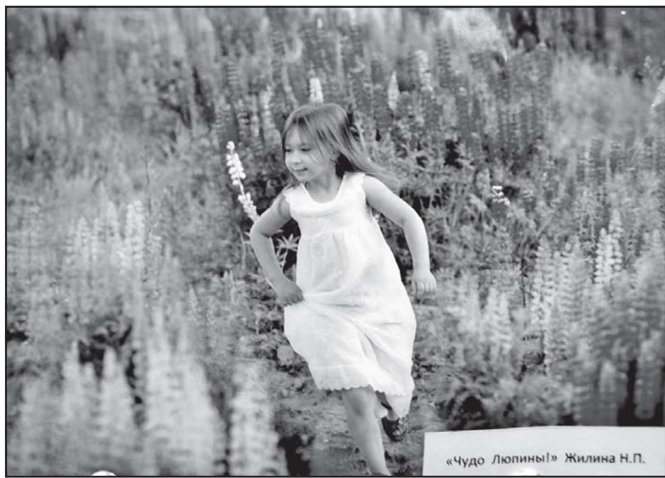
«Чудо Люпины!» Жилина Н.П.