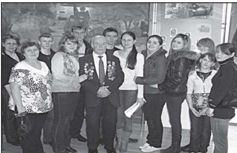
Краеведческий музей в городе Речица, Белоруссия.