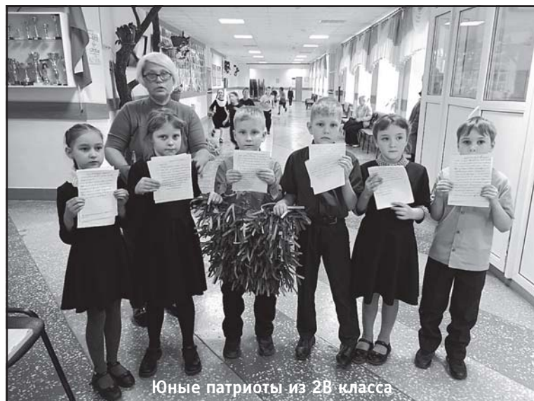
Юные патриоты из 2В класса

Воскресная школа при Храме Воскресения Христова в с. Тогур вносит свой неоценимый вклад в дело помощи воинам. Прихожане и жители с. Тогур плетут маскировочные сети