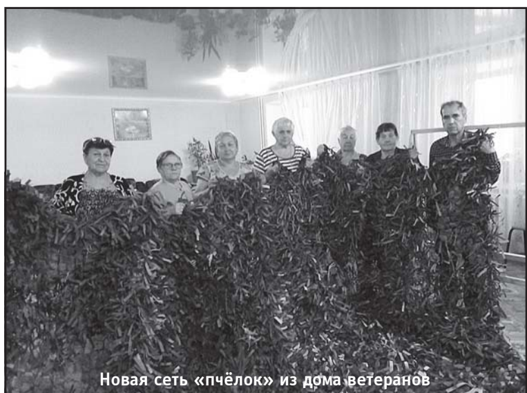
Новая сеть «пчелок» из дома ветеранов