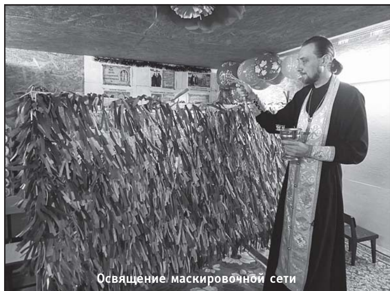
Освящение маскировочной сети