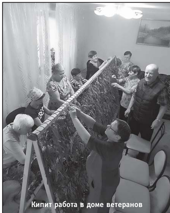
Кипит работа в доме ветеранов