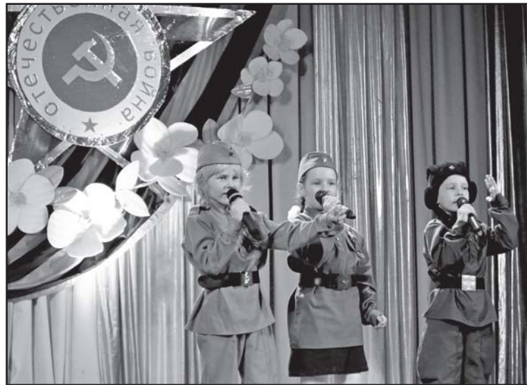
Юные таланты успешно выступили в праздничном концерте «Поём песни Победы»