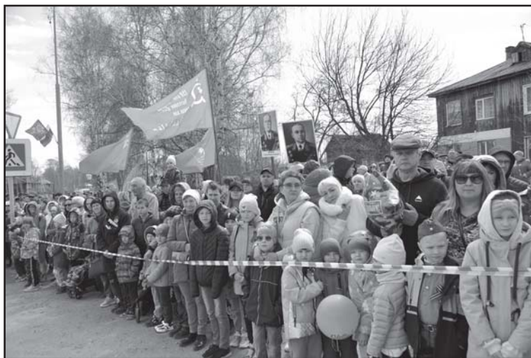
На площади перед памятником Воину-освободителю почтить память павших собрались жители Колпашева