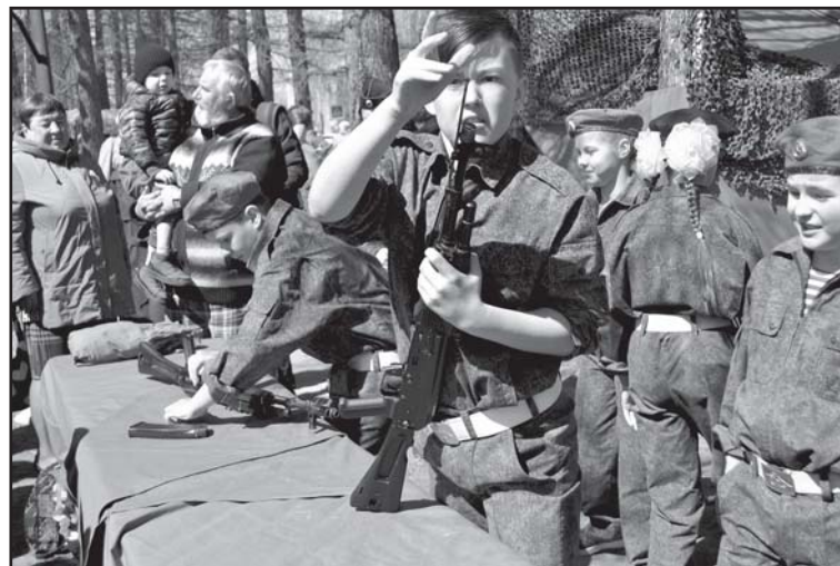
При большом стечении народа около городского Дома культуры 9 Мая работала арт-площадка «На привале»

В Колпашеве в 12 часов на площади перед памятником