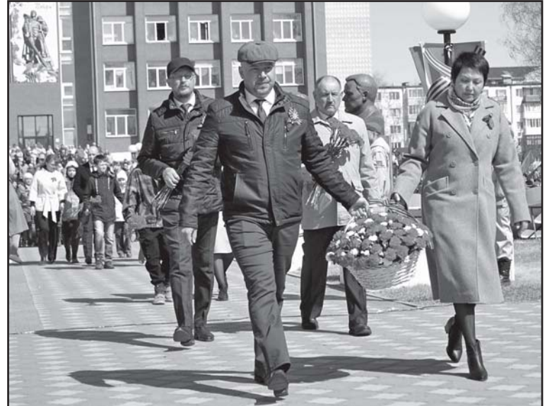
В возложении цветов к мемориалу Воину-освободителю приняли участие жители, представители органов исполнительной и законодательной власти, правоохранительных и силовых структур, молодежных патриотических клубов, предприятий и организаций

песни «Салют! Победа!»; акции «Стихи и песни о Победе», «Палисадник Победы», «Знание. Герои», «Стань ближе к подвигу», «Окна Победы», «Поздравь ветерана», «Парта Героя», «Диктант Победы» и др.