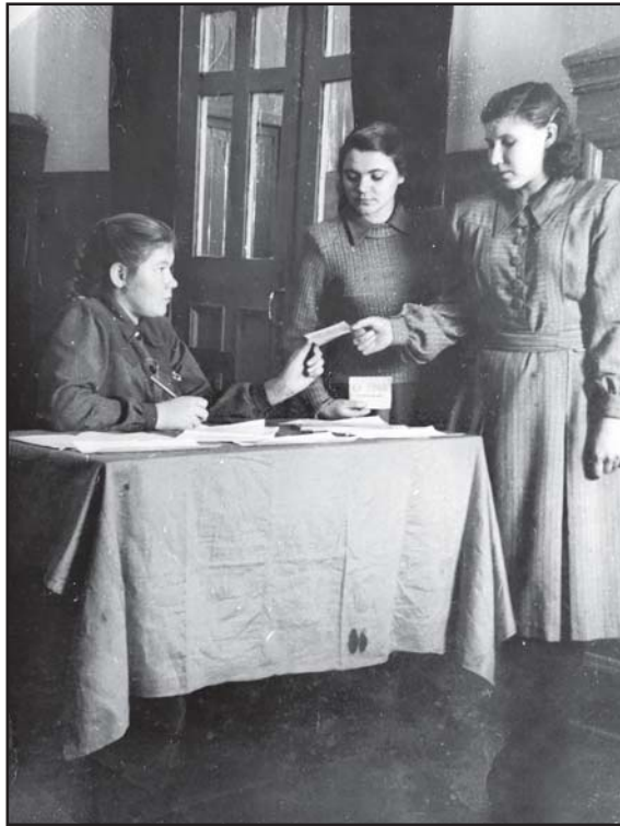
Секретарь-машинистка. Регистрация сельских учителей на конференцию

После четвёртого класса год пропустила, а потом пришлось учиться в д. Север, где набирали пятый класс. Окончила его,