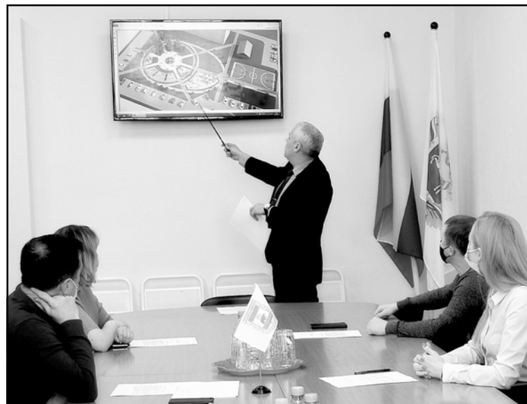
На заседании общественной муниципальной комиссии

В течение января – февраля администрацией городского поселения был организован сбор предложений от граждан