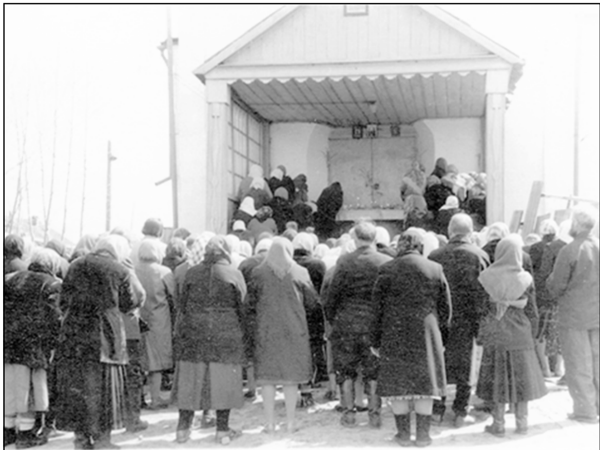
Люди молились у закрытых дверей храма

По её окончании люди благодарили Господа, с любовью кланялись и просили молитв за себя и своих ближних. Бабушка вспоминала, как они с прихожанами собирались вместе, солили капусту с семечками укропа, добавляли туда огурчики, солили кадушками грибы. Вместе ходили в лес и на болота – собирали дикоросы и грибы,