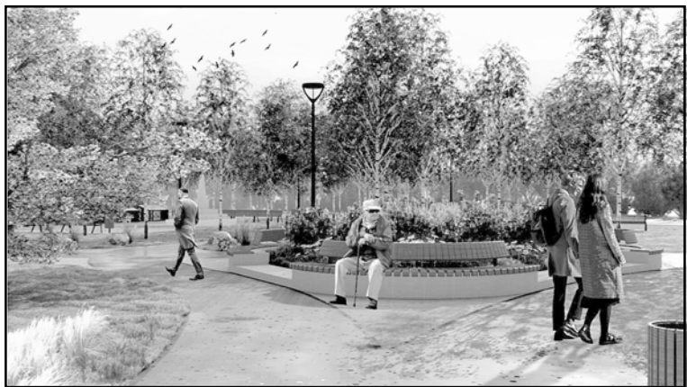
Дизайн-проект «Сквер у памятника воинам Великой Отечественной войны, НГСС»