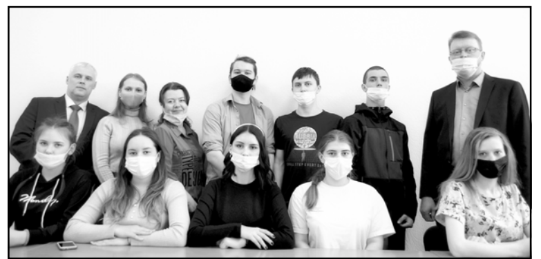
Волонтеры городского поселения готовы к оказанию помощи жителям в рейтинговом голосовании

Голосование проходит с 15 апреля по 30 мая 2022 года. В нём может принять участие каждый гражданин России старше 14 лет, отдав свой голос за одну из предложенных терри-