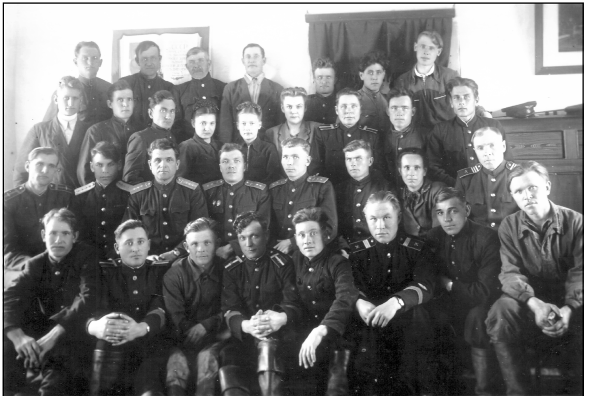
Коллектив аэропорта Колпашево (1953 г.)