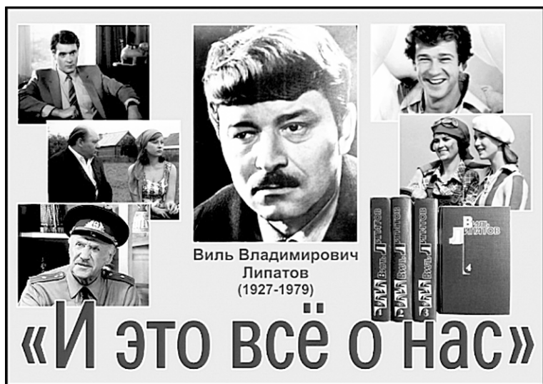
Виль Владимирович Липатов (1927-1979)

ПРИ ПОДДЕРЖКЕ ПРЕЗИДЕНТСКОГО ФОНДА КУЛЬТУРНЫХ ИНИЦИАТИВ