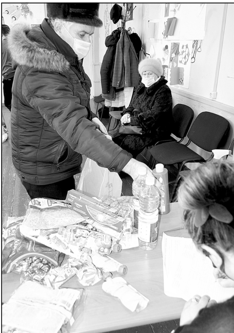
Жители Колпашева принесли гуманитарную помощь