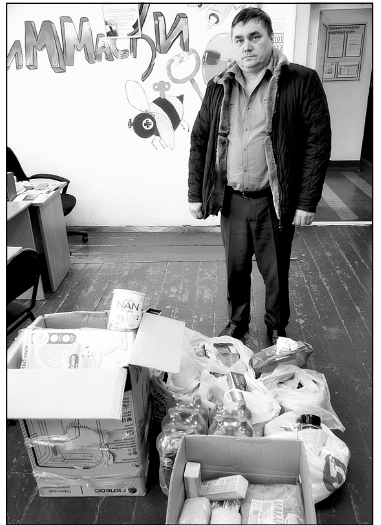
Гуманитарная помощь передается от сотрудников администрации Колпашевского района

им приходится жить – как представишь, что это длится уже 8 лет... Не дай бог... А нашим военнослужащим хотим пожелать, чтобы вернулись с победой, живые и чтобы спецоперация быстрее закончилась.