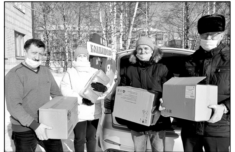
Гуманитарную помощь собрали работники администрации Колпашевского городского поселения

– Мы хотим помочь людям, которые терпят бедствие. И детей жалко, и женщин, всех жалко. Жалко потерять все, что нажито, что выращено. Люди попали в беду, надо им помочь. Если каждый окажет посильную помощь жителям пострадавших республик – это облегчит им жизнь. Взрывы, сырые и холодные подвалы, в которых