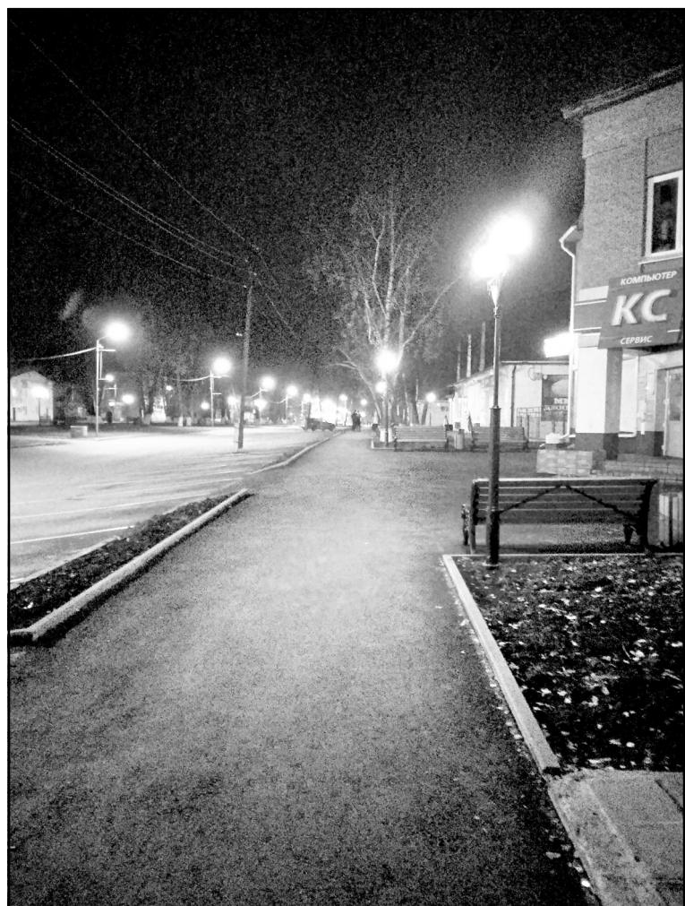
Полностью преобразился тротуар на ул. Белинского

линского (от ул. Кирова до ул. Ленина, нечетная сторона). Выполнены асфальтирование тротуара, озеленение, устройство парковочных мест, осветительного комплекса, ливневой канализации, установлены скамейки, урны и др.