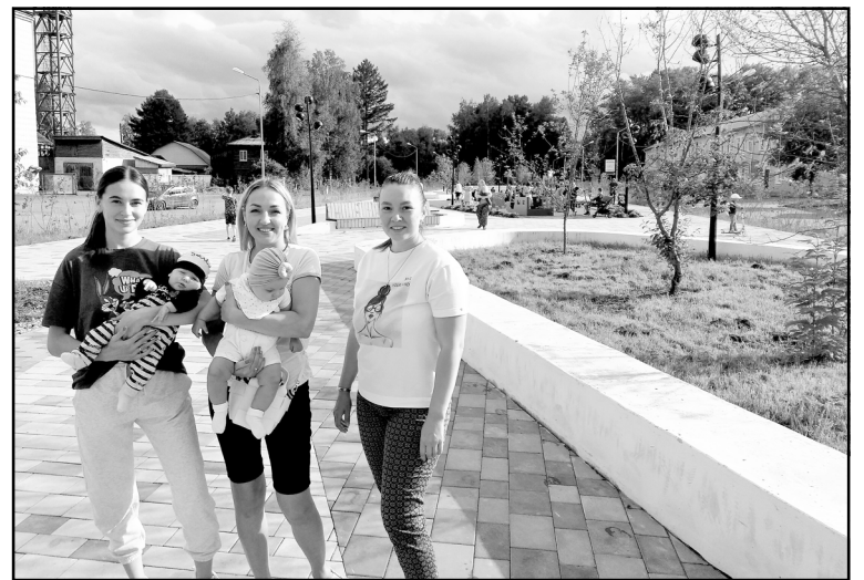
Молодые мамы довольны появлением детских площадок на аллее по ул. Белинского