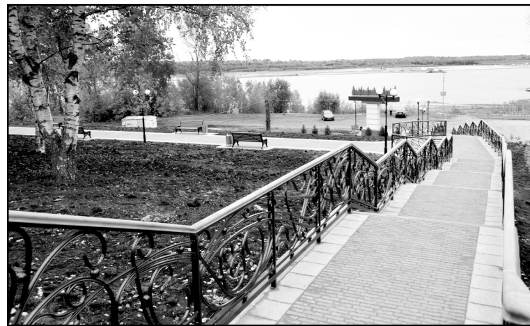
Аллея влюблённых стала еще одним местом отдыха жителей

В текущем году благоустроен пешеходный участок ул. Бе-