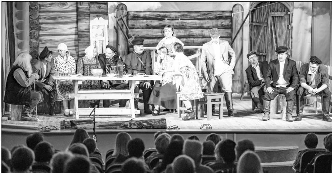
Сцена из спектакля «Сказание об Анне» – участника гастрольного проекта

ментальный фильм о «Красном обозе» 2020 года.