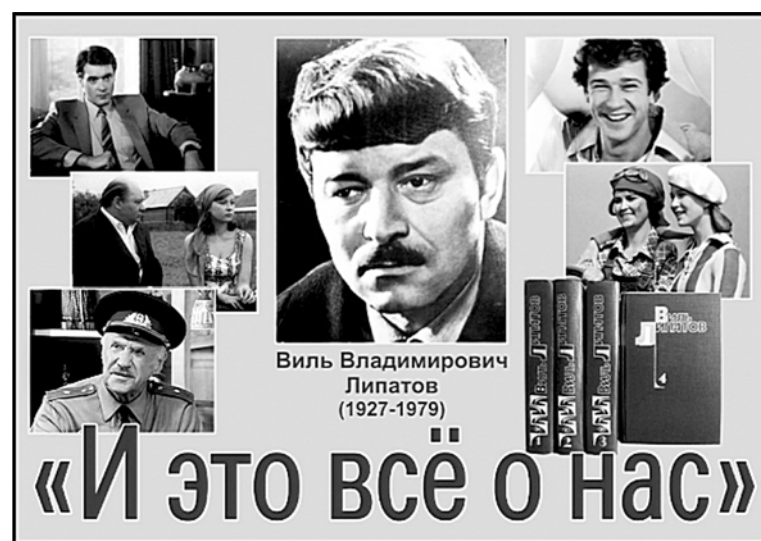
Проект Липатовского межрайонного фестиваля «И это всё о нас» победил на конкурсе Президентского фонда культурных инициатив

дней, одновременно на нескольких площадках (кластерах) будут проводиться: