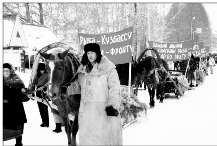
Активное участие колпашевцев в реконструкции событий военных лет, связанных с «Красным обозом», явилось предтечей гастрольного проекта, поддержанного Президентским фондом культурных инициатив