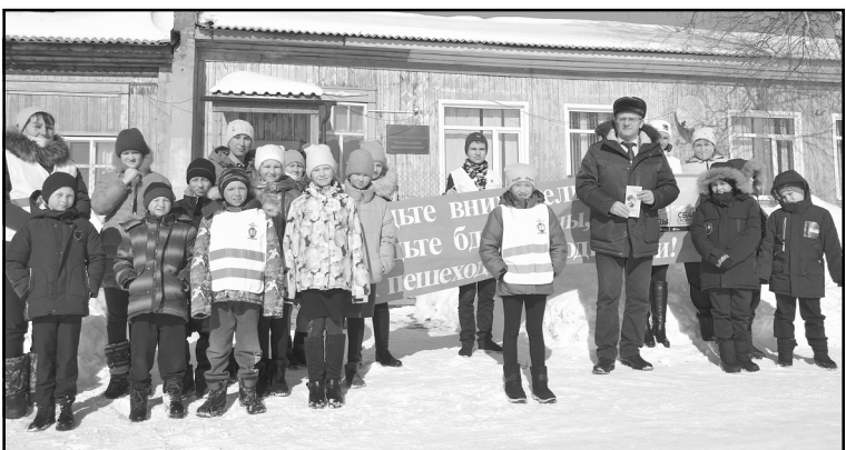
В Копыловке прошла акция школьников «Безопасная дорога»