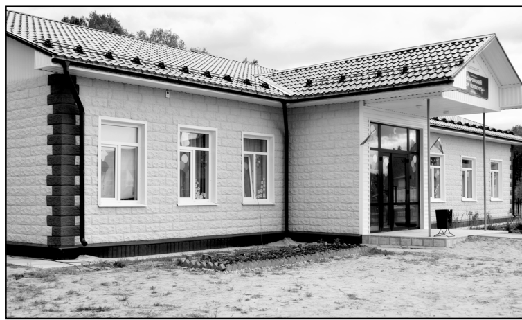
В Большой Саровке открыт новый Дом культуры

– В продолжение темы участия нашего района в нацпроектах расскажите, пожалуйста, о создании модельной библиотеки на базе Центральной библиотеки.