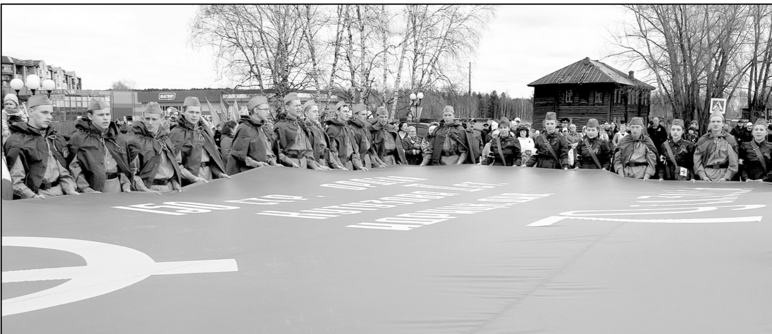
Всероссийская акция «Знамя Победы» прошла в 13-ти населенных пунктах Колпашевского района