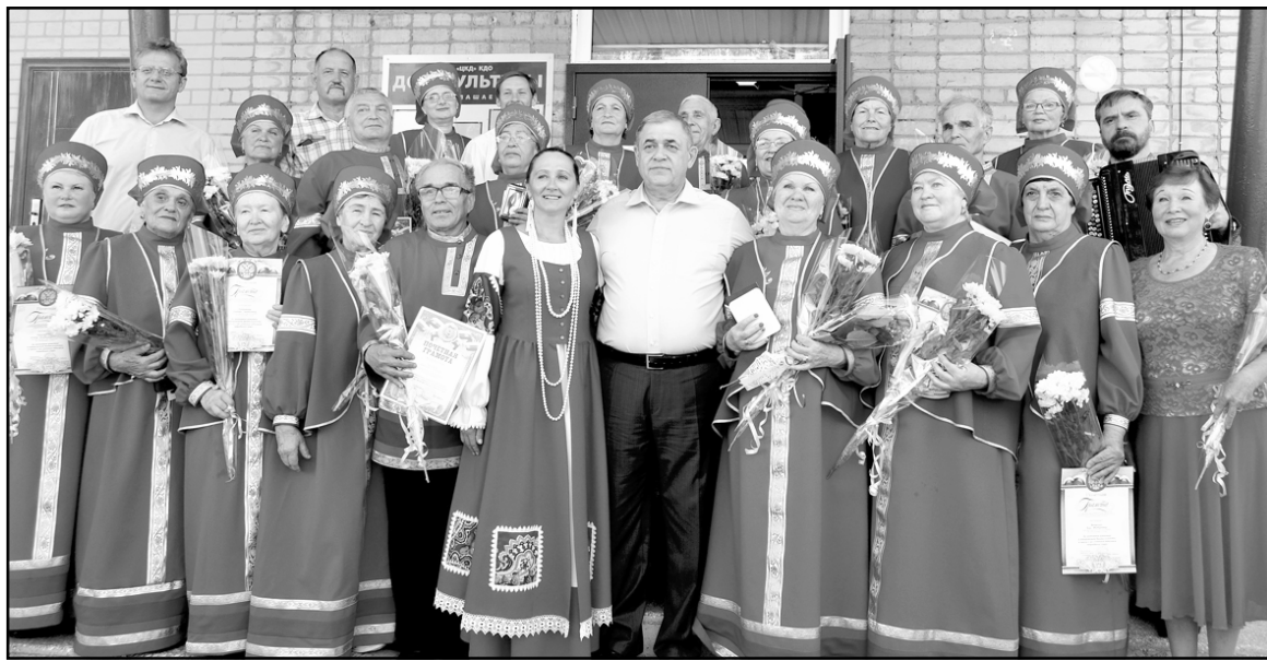
Народному хору «Тогурчанка» – 30 лет

фика движения с учетом предложений населения, частичная замена ГАЗелей на ПАЗики на городских маршрутах, повышение комфортности и надежности на междугородних сообщениях, обеспечение технического контроля и обслуживания.