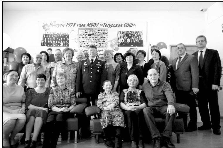
На торжественном мероприятии, посвященном присвоению Тогурской школе имени Героя России Сергея Маслова

– В связи с возникшей в марте–апреле 2021 года угрозой прекращения пассажироперевозок было принято решение о привлечении новой организации для создания качественно нового уровня оказания услуг по перевозке пассажиров, как по комфортности, так и безопасности. Меры, которые принимает руководство нового пассажироперевозчика, очевидны: организация гра-