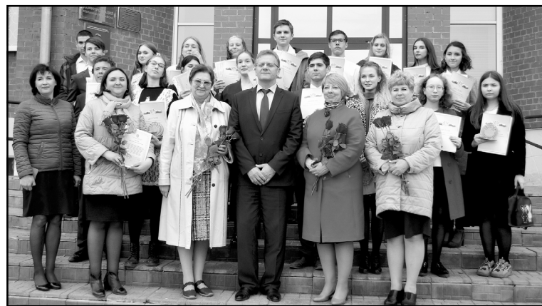
Чествование победителей и призеров регионального этапа Всероссийской олимпиады школьников

Я восьмой год работаю главой района и с первого дня своей работы занимался этим вопросом. Было очень много сложных моментов и непредвиденных ситуаций. Важным фактором здесь было решение администрации Томской области и Федеральной антимонопольной службы России об утверждении единого тарифа на транспортировку газа на территории Томской области, благодаря чему в городе Колпашево и селе Тогур данный тариф снижается не менее чем на 20%.