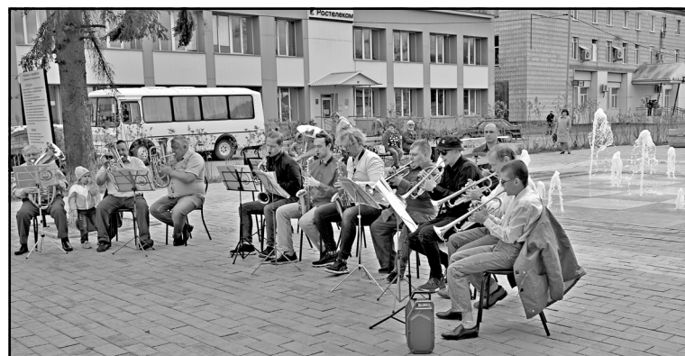
На новой аллее по ул. Белинского играет духовой оркестр «Заря»