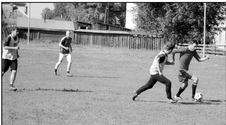
В атаке – футболисты «Спасателя»