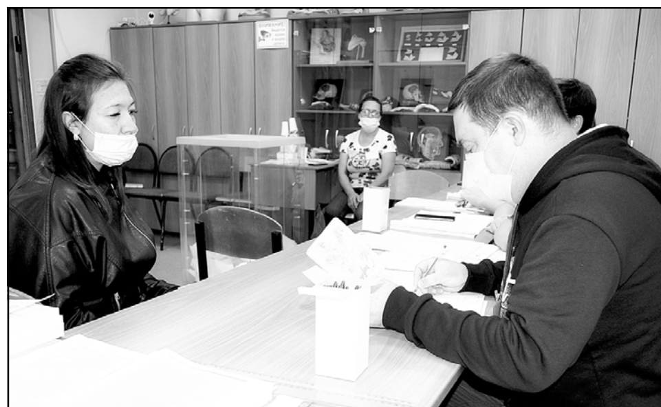
Момент голосования 19.09.2021 на избирательном участке №321