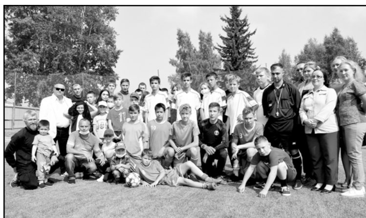
После завершения товарищеского матча