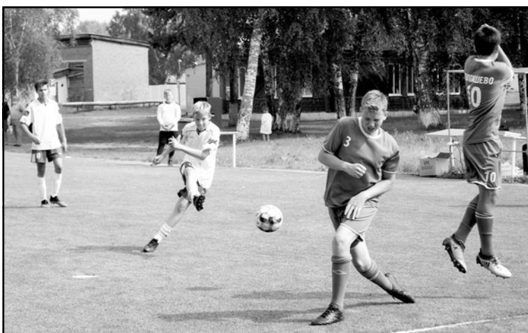
Пробитие первого штрафного удара на новой футбольной площадке