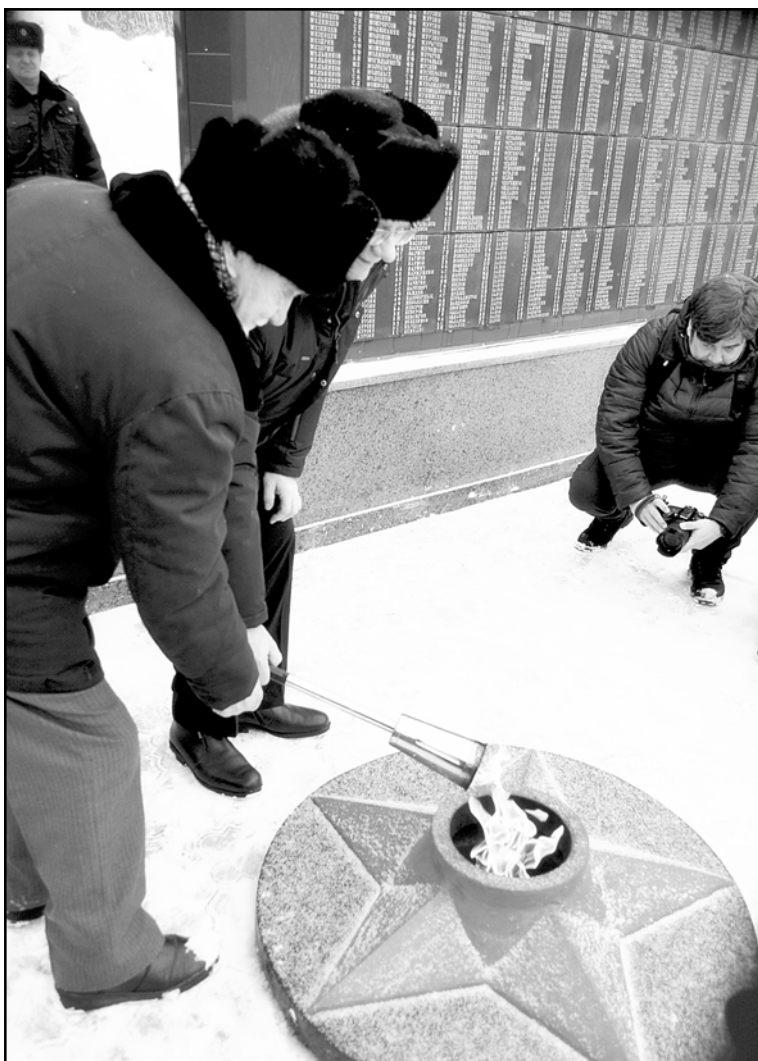
В Колпашево 22 февраля 2020 года открылся новый комплекс «Вечный огонь»

Традиционно осуществлялось строительство и содержание автомагистрали «Тогур – Иванкино», возводились и содержались ледовые переправы через р. Кеть и пр. Северскую на автозимнике «Тогур – Север –