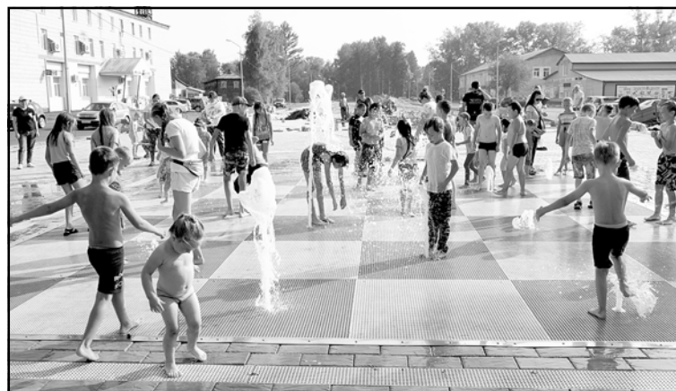
Светодинамический фонтан появился в Колпашеве, благодаря участию Колпашевского района в нацпроекте «Жильё и городская среда»

Особое внимание в муниципальных образовательных организациях уделяется развитию непрерывного технического образования, в том числе в рамках изучения образовательной робототехники. Одним из результатов реализации муниципального проекта по робототехнике являются достижения в 2020 году на соревнованиях регионального уровня: обучающиеся нашего района заняли тринадцать призовых мест на Кубке губернатора Томской области по образовательной робототехнике среди детей; 2-е место – в состязаниях «ScratchLine движение по линии» на региональной олимпиаде по образовательной робототехнике школьников Томской области.