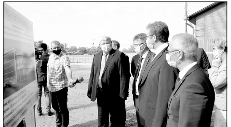
Губернатор Томской области С. А. Жвачкин на объекте строительства ФОКа (нацпроект «Демография»)

В рамках VIII очереди 1 этапа газификации возможность газифицировать появится у собственников 128 домовладений.