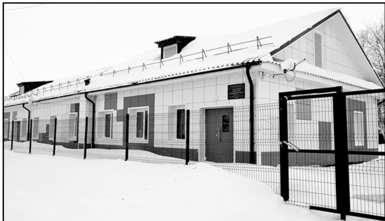
В 2020 году, благодаря поддержке главы региона, проведен капитальный ремонт МБДОУ «Чажемтовский детский сад» в с. Озёрное

Огромное внимание органов местного самоуправления Кол-