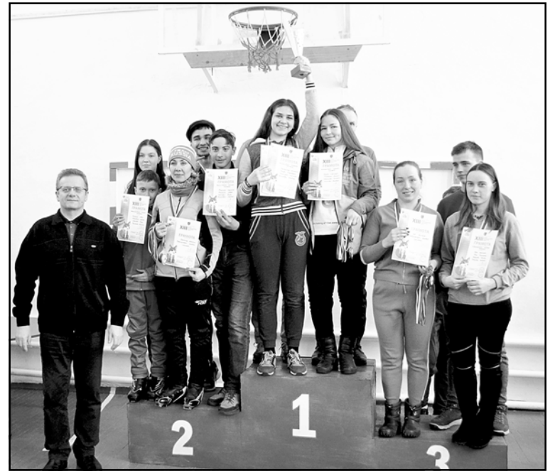
В селе Чажемто 7 марта 2020 года успешно прошла XIII зимняя межпоселенческая спартакиада Колпашевского района

Один из первоочередных приоритетов в социальной сфере – сделать медицинскую помощь более доступной для каждого