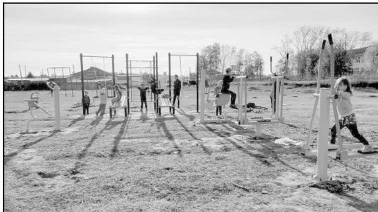
Благодаря участию Колпашевского района в федеральной программе Российской Федерации «Комплексное развитие сельских территорий», в Мараксе появилась новая спортивная площадка с уличными тренажерами и гимнастическим комплексом Workout

В перспективе развития сферы культуры на территории района планируется дальнейшее укрепление материально-технической базы отрасли культуры. Так, разрабатываются проектно-сметные документации на капитальный ремонт городского Дома культуры, строительство здания Дома культуры на 150 посадочных мест в с. Чажемто.