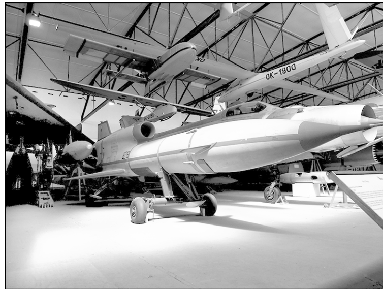
БПЛА Ту-143 «Рейс»

Но самые первые отечественные БПЛА появились еще