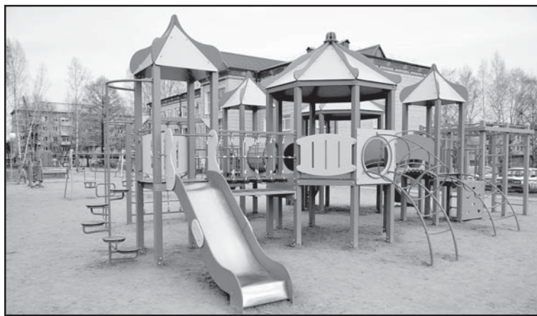
По адресу: ул. Кирова, 43 создан Городской детский спортивный комплекс

Продолжалась работа по укреплению материально-технической базы и содержанию спортивных объектов, состоящих на балансе МКУ «Городской молодежный центр», в том числе: установлена двухъярусная трибуна с подтрибунным помещением для запасных игроков для хоккейного корта на тогурском стадионе (государственная программа Российской Федерации «Комплексное