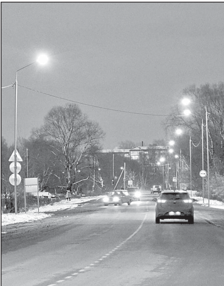
На ул. Портовой заменены 44 опоры освещения и 45 светильников

Волонтеры Городского молодёжного центра помогают пенсионерам и маломобильным гражданам пережить пандемию коронавируса в рамках Всероссийского проекта #МыВместе (Всероссийская акция «Продуктовая помощь»)