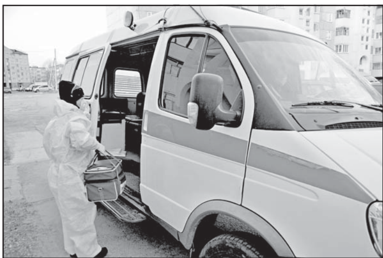
Скорая помощь приехала по вызову