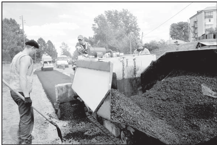
Ведутся работы по устройству пешеходного тротуара по ул. Портовой

Для дальнейшей газификации за счет средств, выделенных в 2019 году из районного бюджета, подготовлен и проходит государственную экспертизу проект для строительства газопроводов VIII очереди (1 этапа), в котором предусмотрен подвод газа к 130 домам Тогура (ул. Рабочая, с 5 по 44) и Колпашева (частично –