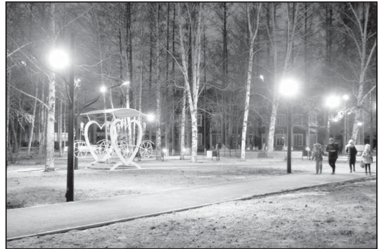
Полностью преобразилась территория около городского Дома культуры

шли целенаправленно с 2014 года, планомерно и последовательно проводя реконструкцию тогурского спортивного стадиона: строительство здания с раздевалками для спортсменов и прокатом коньков; устройство катка с качественным ледовым покрытием; организация детской хоккейной секции; приобретение хоккейной формы и инвентаря (благодаря помощи облас-