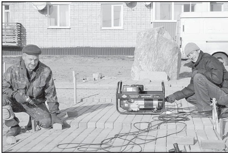
Выполняются работы по устройству нового сквера в селе Тогур

шевского краеведческого музея»; «Сквер с детской игровой площадкой в с. Тогур, ул. Советская». Общественная территория, расположенная по ул. Белинского (от ул. Ленина до ул. Комсомольской), была выбрана жителями для