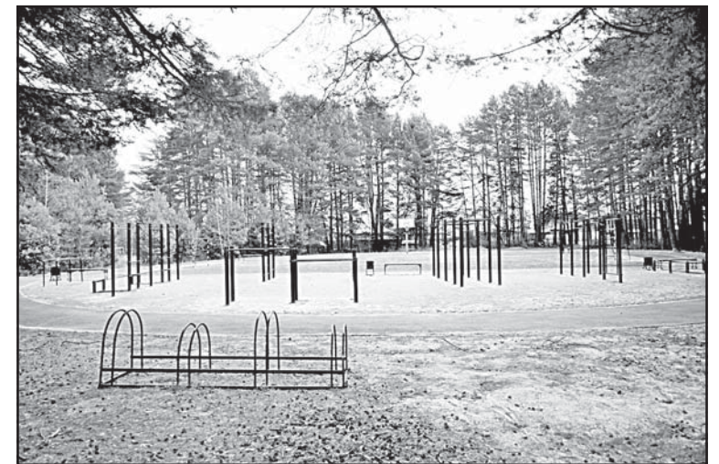
В городском парке появились новые асфальтированные дорожки для пешеходов, велосипедистов, а также – спортивная зона для мини-футбола, стрит-бола, воркаута

Не забываем и про ремонт дорог по другим улицам: в настоящее время прорабатываем варианты изыскания средств для восстановления дорожного покрытия с применением битумомине-