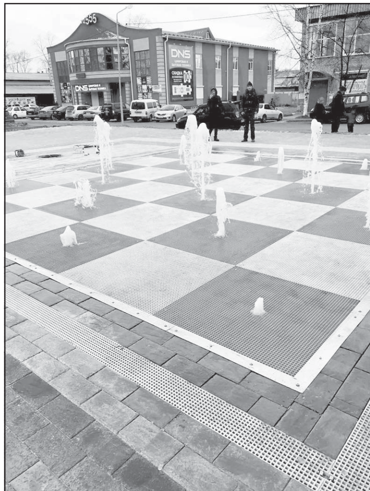
Светодинамичный фонтан на ул. Белинского

шевского краеведческого музея»; «Сквер с детской игровой площадкой в с. Тогур, ул. Советская». Общественная территория, расположенная по ул. Белинского (от ул. Ленина до ул. Комсомольской), была выбрана жителями для