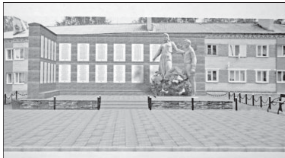
Так, в соответствии с проектом, будет выглядеть монумент после реконструкции.

Сам памятник также подвергнется реставрации, на нем будут устранены дефекты, возникшие за прошедшие годы. Основание скульптурной группы обнесут серым бордюрным камнем.