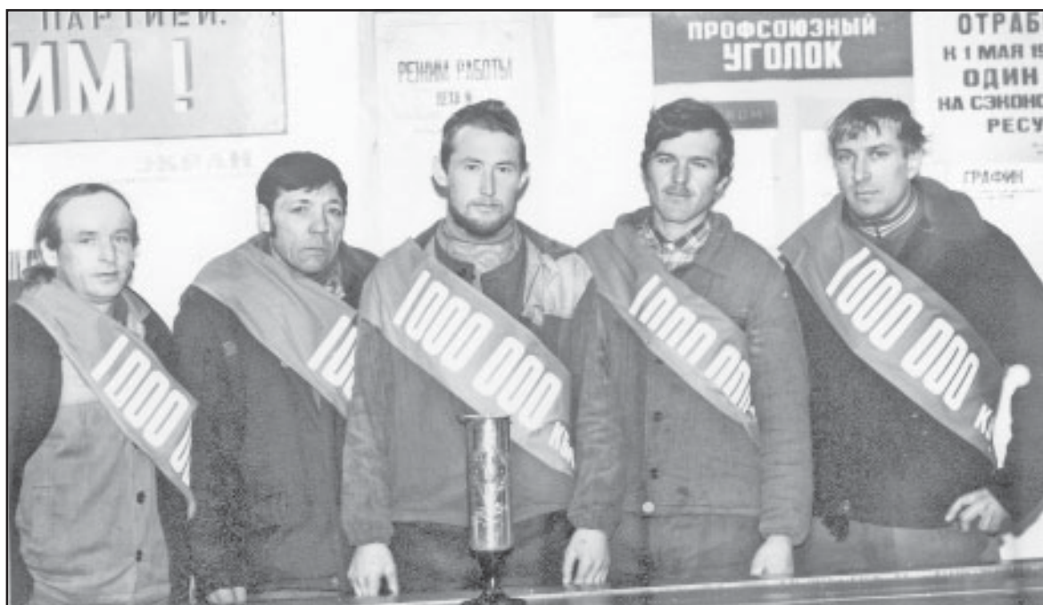
Работники Дальненского лесозаготовительного пункта.