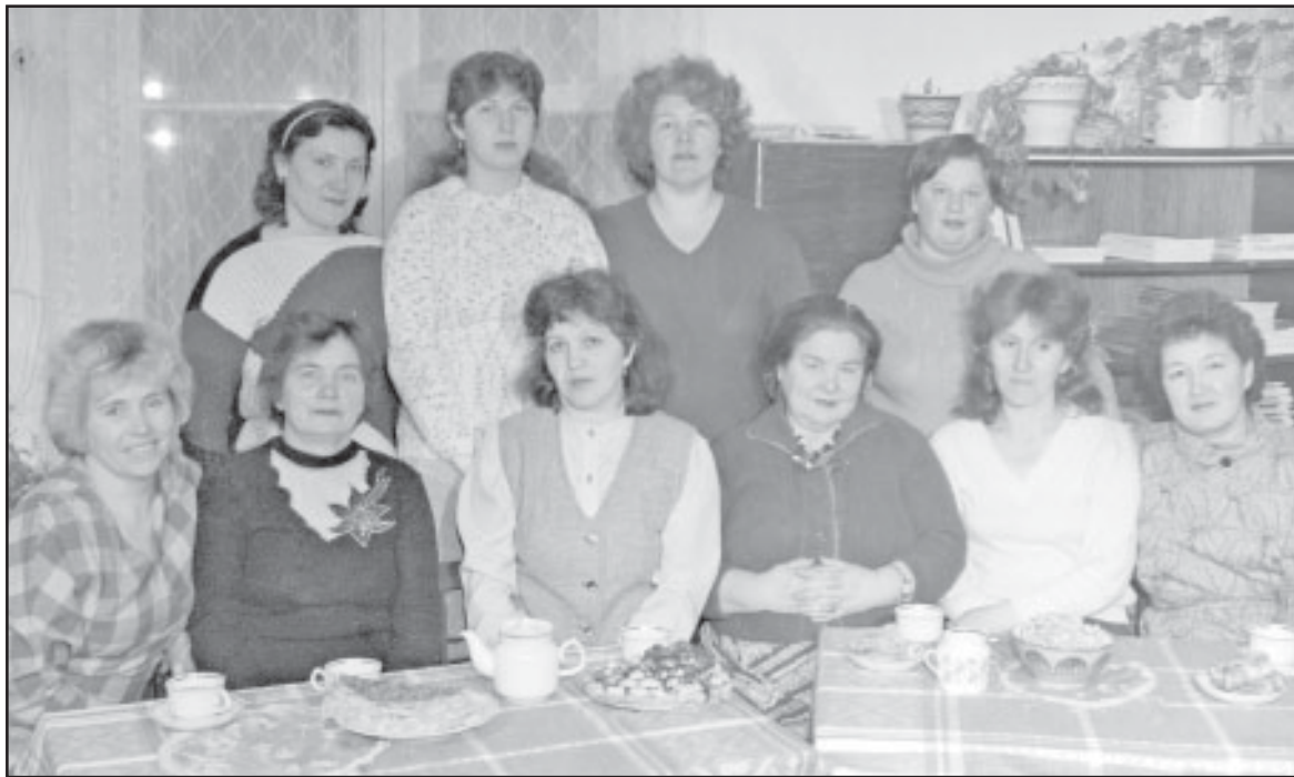
Участницы клуба «Хозяюшка» при библиотеке п. Дальнее (1989 г.).