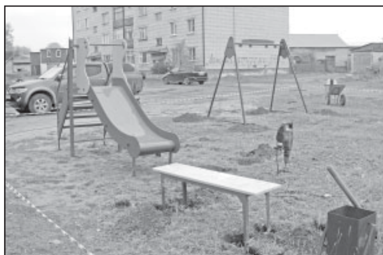
Новая игровая площадка на Обской.

Новую площадку установили во дворе дома, в непосредственной