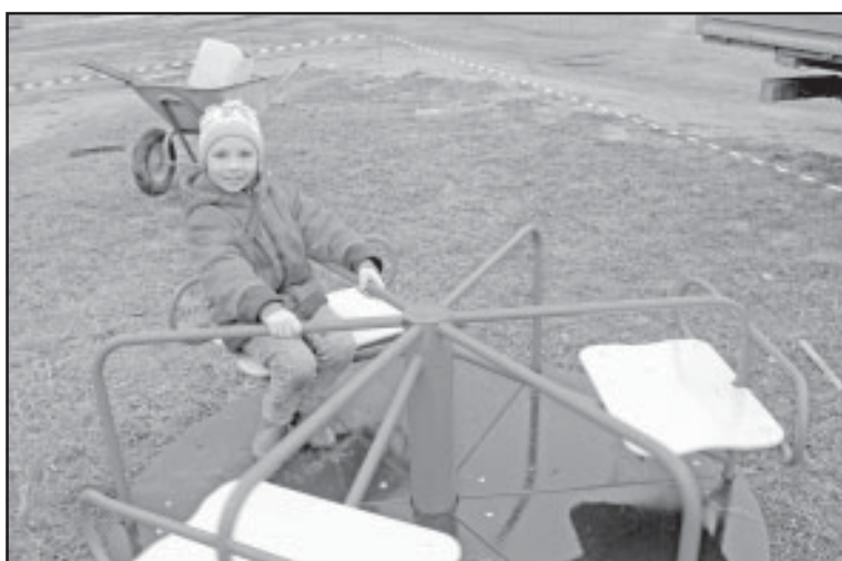
Дети хотят, чтобы возле дома было место для игр, а не автомобильная парковка.

– Постановлениями администрации Колпашевского городского поселения, утвержденными решением Совета поселения, в целях содержания в надлежащем состоянии муниципального имущества