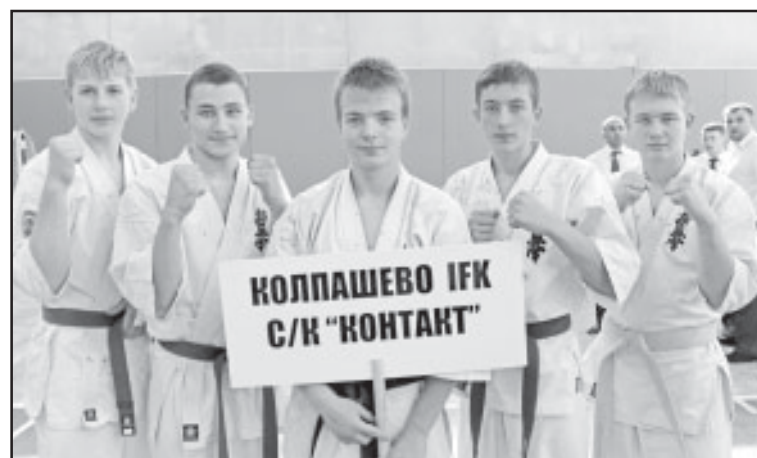
«Мастера» из клуба «Контакт».