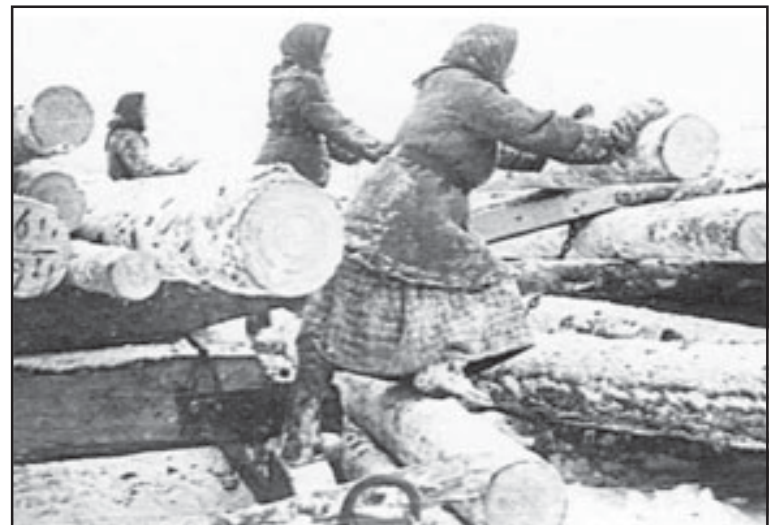
Труд на лесозаготовках тяжел даже для мужчин, а работать приходилось женщинам и девочкам-подросткам.

Жизнь стала налаживаться, но семья находилась под контролем комендатуры. Каждую неделю они были вынуждены ходить на отчетку. Покидать место проживания без разрешения коменданта строго запрещалось. На спецпоселенцев-латышей