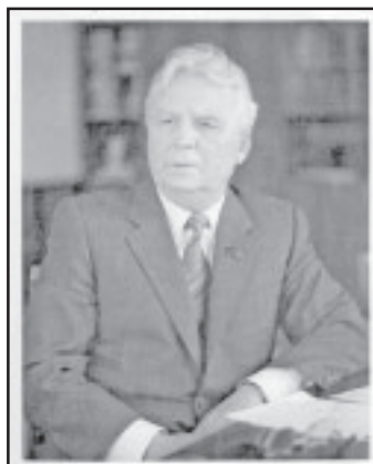
Е. К. ЛИГАЧЕВ

Одним из таких изданий стал томик избранных речей Е. К. Лигачева. 17 лет – с 1965 по 1983 год – Егор Кузьмич возглавлял Томскую область. В 1983 году он был назначен заведующим отделом ЦК КПСС. В конце того же года его избрали секретарем ЦК партии. В 1985–1988 годах Лигачев фактически был вторым человеком в партии и государстве. В 1989–