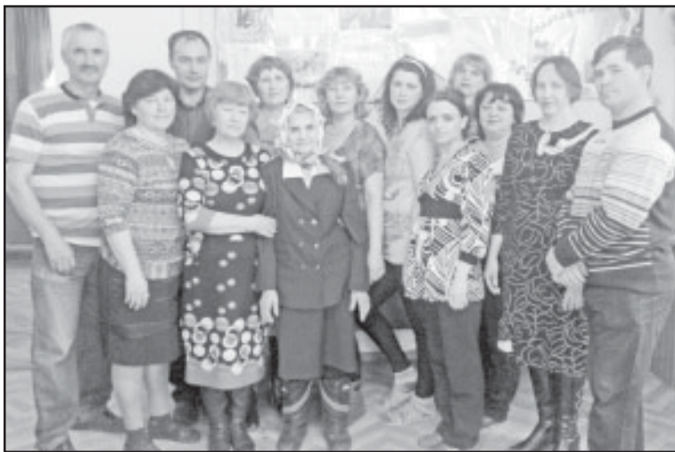
Каждая встреча для этих людей – настоящий праздник!

Как много значит для людей со слабым зрением общение, и каждая встреча для них – праздник!