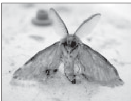
Бабочка сибирского шелкопряда.

В июне–июле 2013 года были расставлены феромонные ловушки на выявление сибирского шелкопряда и непарного шелкопряда.