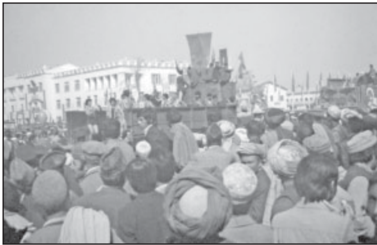
В 1979 году демонстрациями были охвачены уже многие провинции Афганистана.

21 марта. Новогодняя речь Нур Мухаммеда Тараки по афганскому радио. Запись на диктофон. Суть: верные ему войска освободят