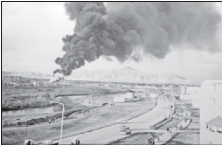
Одна из первых диверсий.

Убит наш торговый заготовитель, скончался от ран ветврач. Убит охранниками военсоветник, майор 34 лет. Он руководил эвакуацией наших людей. Семьи и специалисты вывезены почти в нижнем белье на бронетранспортерах и затем самолетом. Представителя торгпредства убили и надругались. Перед тем, как погибнуть, он успел передать в Кабул: «Это, возможно, мои последние слова, они приближаются...».