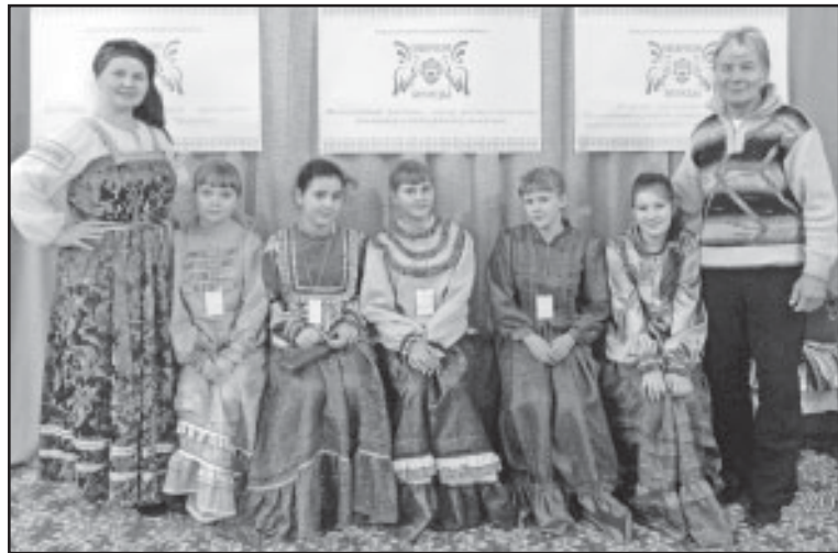
Коллектив из ДЮЦа стал украшением «Сибирских бесед».

Без сомнения, эта поездка в дни осенних школьных каникул учас-