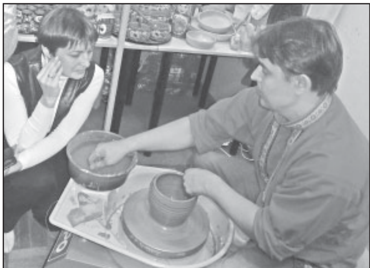
Умельцы давали мастер-классы всем желающим.

Было что показать и колпашевскому фольклорному ансамблю. «Горенка» стала активным участником практически всех мероприятий, проводившихся в рамках форума. Особенно понравились девушкам и их руководителю мастер-классы. Изготовление керамических изделий, вышивка, создание традиционных украшений и предметов праздничного убранства, приготовление национальных блюд – все это воспитанницы ДЮЦа не только увидели собственными глазами, но и могли попробовать сделать самостоятельно. Помимо многочис-