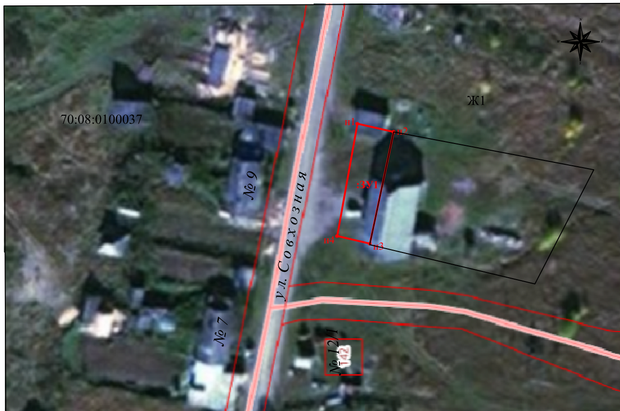
Схема расположения земельного участка на кадастровом плане территории